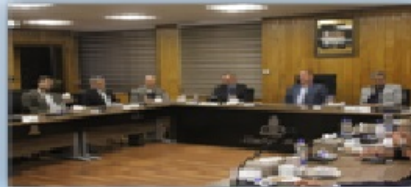
جلسه با مسئولان منطقه