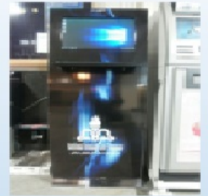
کمیونیکیشن، اطلاع رسانی و نظارت‌ها از سرانجام