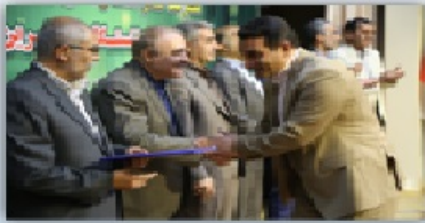
تفویض و شرح تکالیف